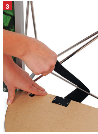
Wrap both velcro straps around the bottom horizontal struts of the display wall.