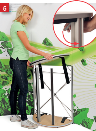
Attach the top shelf on top of the T-bars and front posts and lock the FASTclamp.