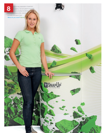
You are ready!