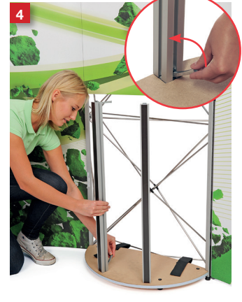
Mount the two front posts and lock the FASTclamp.