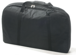
Extra Bag for table attachment Item IS-80-TB05